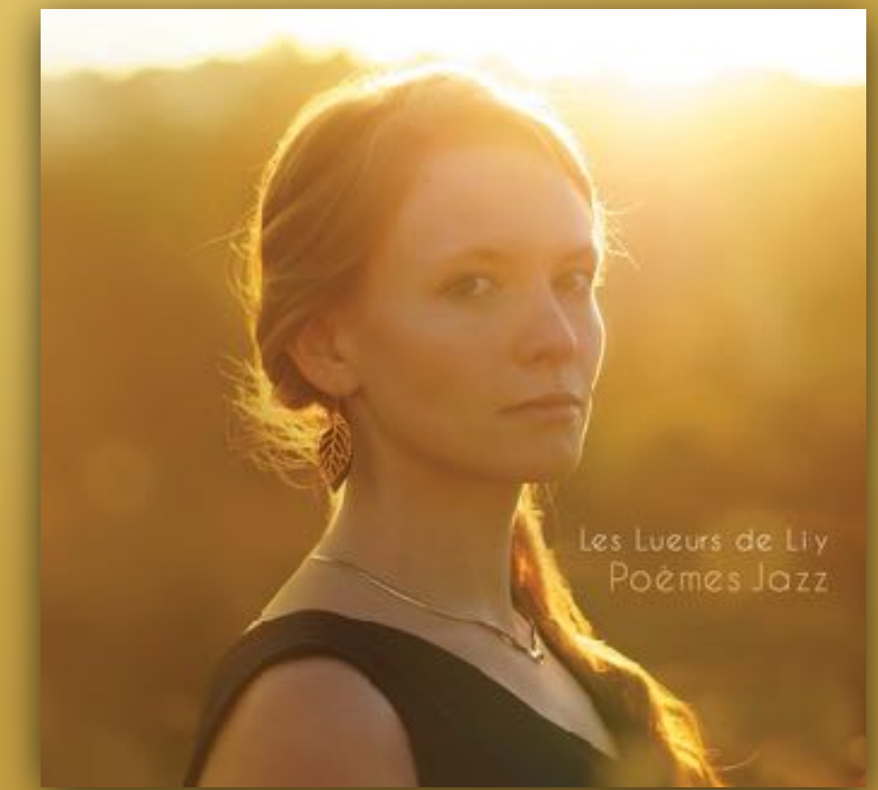
Nouvel album Poèmes Jazz